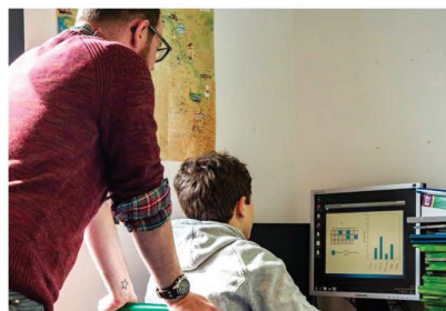
1. Les structures d'accueil de la DIR

Basée à Lille, elle regroupe la région administrative Hauts-de-France.