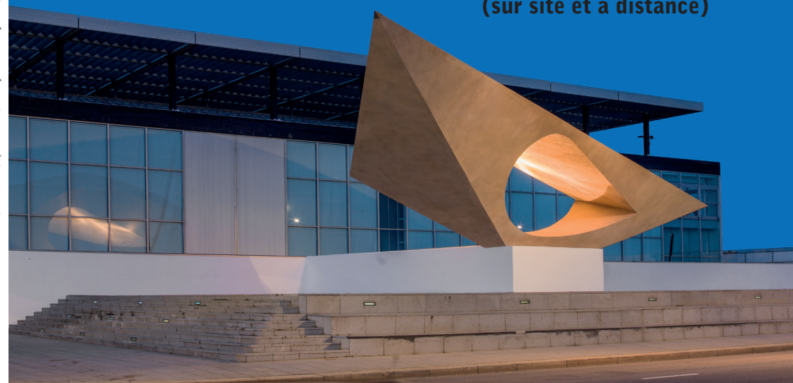
Fabrication : Transfaire - Photo de couverture : MuMa, vue d'ensemble, façade nord-ouest, vue du Sgrat d'Irénée-Georges Adam, 2012.

Musée de la Chasse et de la Nature (sur site et à distance)